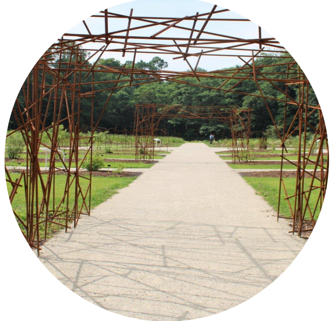
Bomen zorgen voor schaduw in parkeertuin

We willen geen parkeerplaats, maar een parkeertuin. Daarom passen we zachte materialen toe, beweeglijke bomen en een speels lijnenspel. De bomen lopen in knallende kleuren uit in het voorjaar en knallen nog eens in de herfst. Bloeiende hagen in de winter helpen mee aan de biodiversiteit. Speels lijnenspel als informele aanduiding parkeervakken met ruimte voor 28 auto's. Plaatsing van bomen tussen de auto's zorgen voor schaduw en sfeer. De basismaterialen in ton sur ton kleuren, alle materialen zijn onderling afgestemd, op de architectuur en op de omgeving.