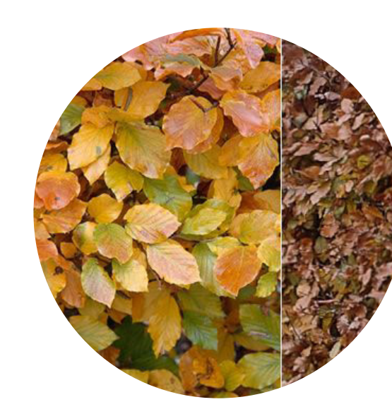
Het blijft in ieder geval een natuurlijke omgeving!