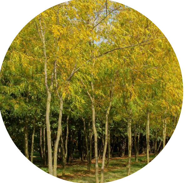
Bomen verkleuren met de seizoenen mee, seizoensbeleving!