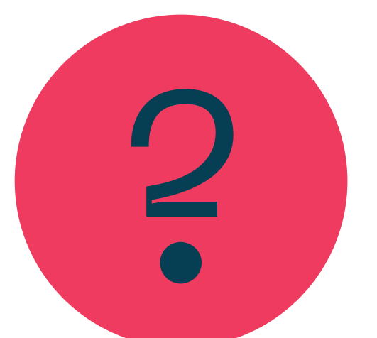
Samen nadenken over de invulling