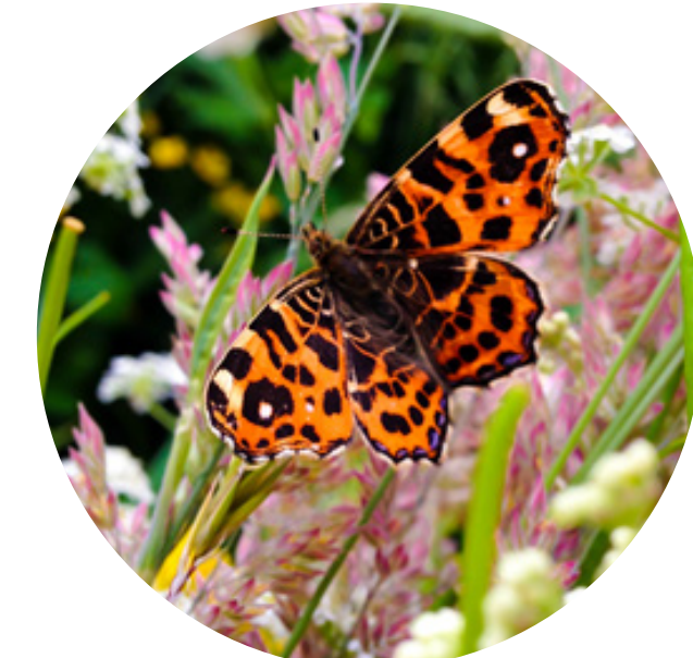
Biodiversiteit is een belangrijk onderdeel van het ontwerp