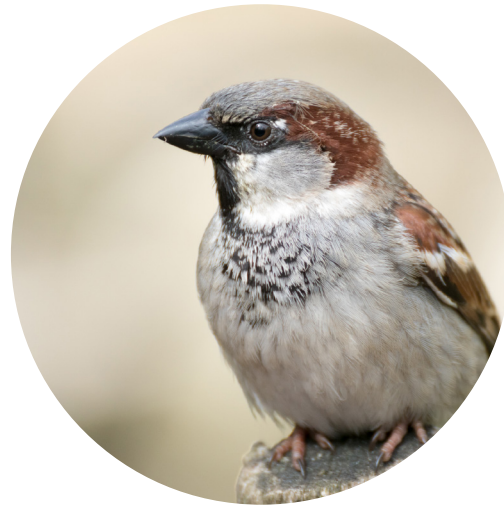
Integratie nestplekken voor diverse soorten vogels