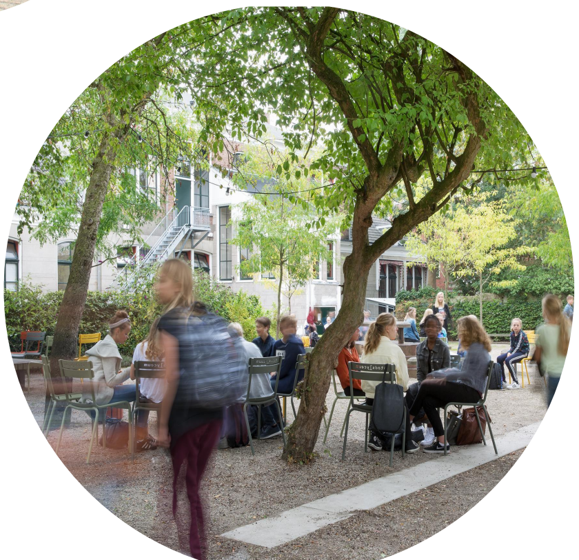
Halfverharding met lijnenspel zorgt voor herkenbare unieke plek