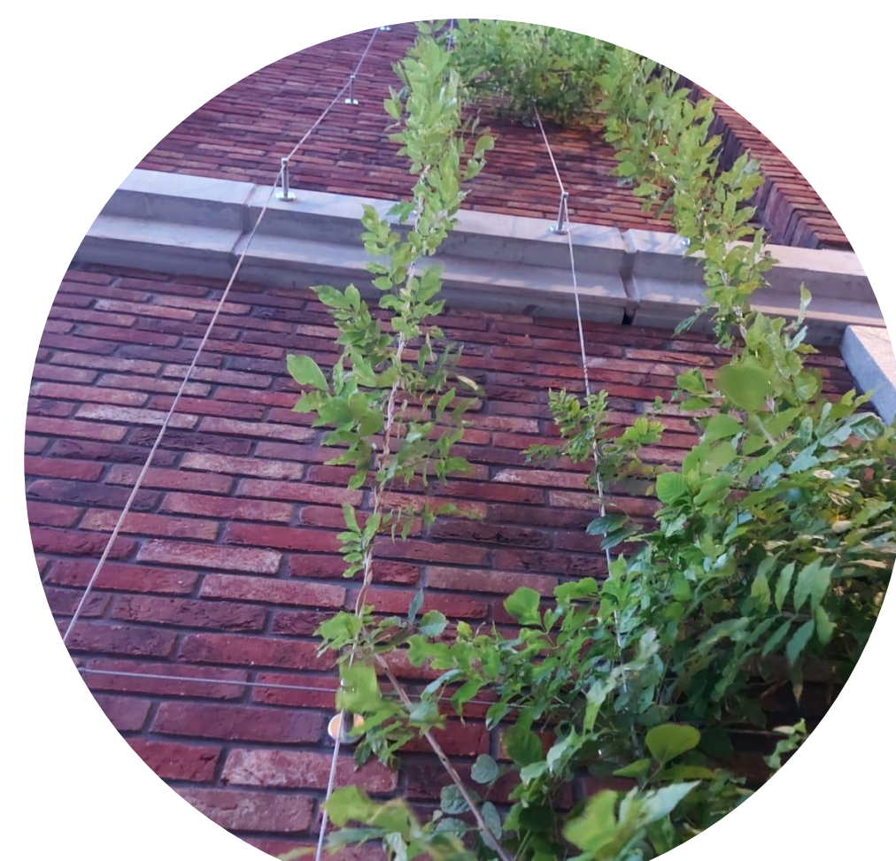
Staaldraad langs gevel voor verticaal groen