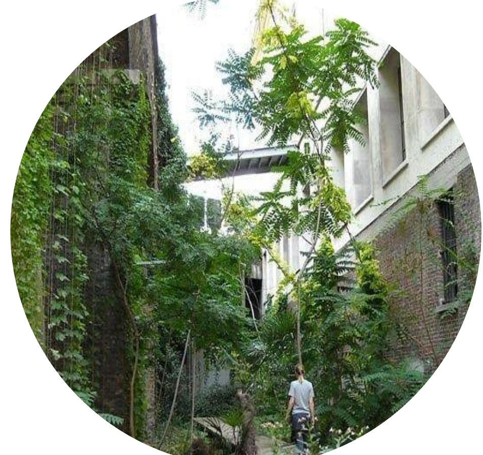
Groenblijvende klimmende planten geïntegreerd in gevels