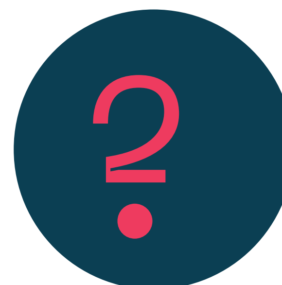
Wat willen de bestaande bewoners met deze zone?